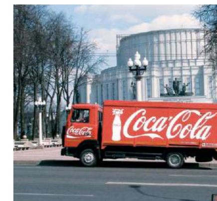
Брендированные грузовики Coca-Cola можно встретить и на столичных улицах, и в небольших сельских населенных пунктах страны