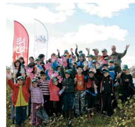
Волонтеры очистили около 5 км берега реки Припять от отходов пластика