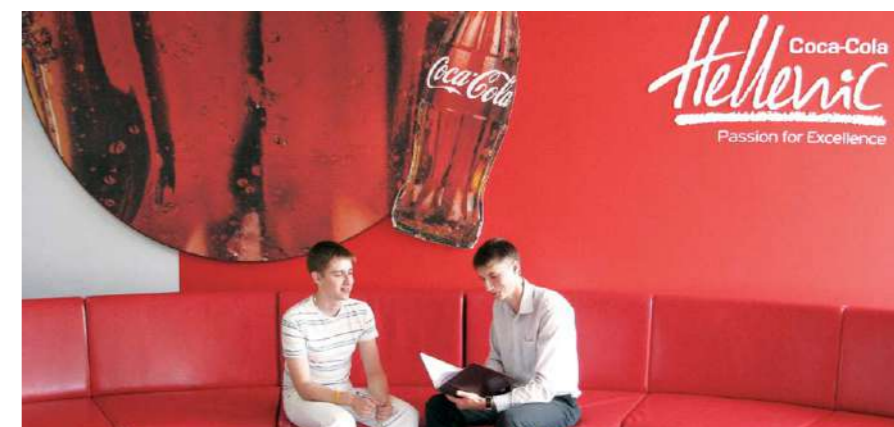
Интерьер холла соответствует общему стилю, которого придерживаются все предприятия группы Hellenic