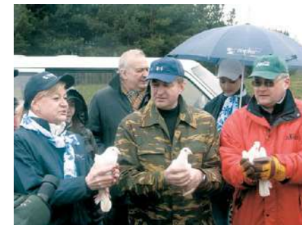
Природоохранная акция «Лебяжий: птицам и людям. Вместе!»

Успех наших совместных акций — свидетельство плодотворного сотрудничества между государством и бизнесом на пути к устойчивому развитию!