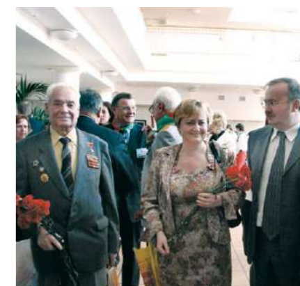
Праздничное мероприятие, посвященное 65-летию Победы в Великой Отечественной войне