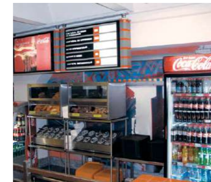
Благодаря торговому оборудованию, предоставленному ИП «Кока-Кола Бевриджиз Белоруссия», потребитель имеет возможность приобрести охлажденные напитки в любом удобном для него месте