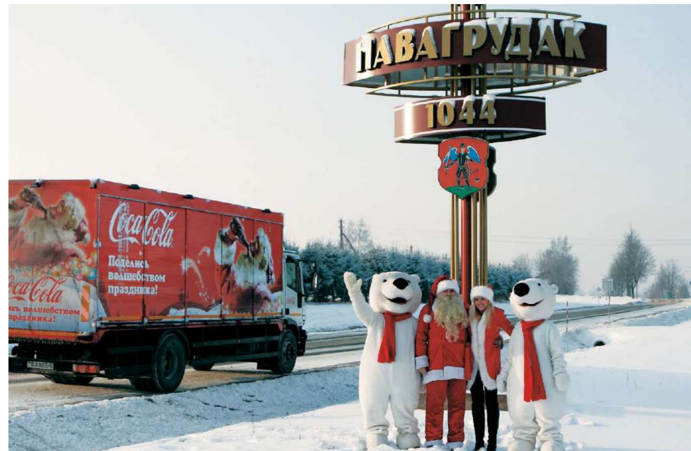
Сотрудники предприятия сами перевоплощаются в персонажей новогоднего каравана Соса-Кола