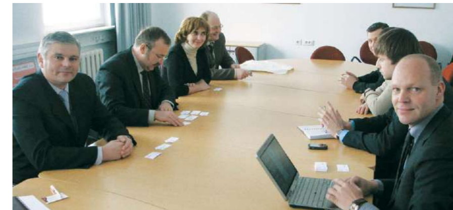
Встреча с представителями компании Microsoft

Работа в системе SAP Wave2 приведет к улучшению качества сервиса, что повлечет за собой повышение удовлетворенности поставщиков, заказчиков и потребителей. Таким образом, реализация проекта будет способствовать наиболее полному воплощению стратегической цели ИП «Кока-Кола Бевриджиз Белоруссия» — быть предприятием, ориентированным на клиента.