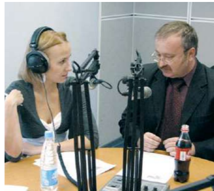
ИП «Кока-Кола Бевриджиз Белоруссия» активно участвует в работе по совершенствованию инвестиционного законодательства