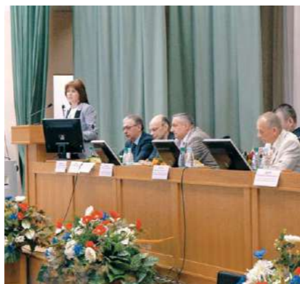
V Республиканская научно-практическая конференция «Актуальные вопросы детской хирургии»

В апреле 2009 года на полках магазинов страны появилась первая партия напитка ФрукТайм с логотипом акции на этикетках. Ежемесячно предприятие перечисляло часть прибыли от продажи каждой бутылки ФрукТайм Белорусскому детскому фонду в качестве безвозмездной помощи на развитие программы «Теплый дом», направленной на поддержание семейных детских домов. В каждом детском доме семейного типа, кроме собственных детей, воспитывается от 5 до 10 детей-сирот.