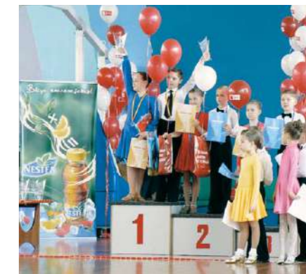
Поддержка соревнований по бальным танцам