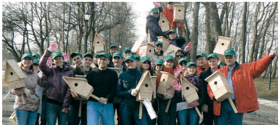
Сотрудники предприятия с энтузиазмом приняли участие в акции