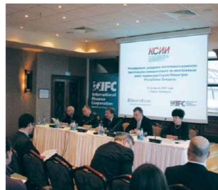
Заседание постоянного комитета при Консультативном совете по иностранным инвестициям при Совете Министров Республики Беларусь