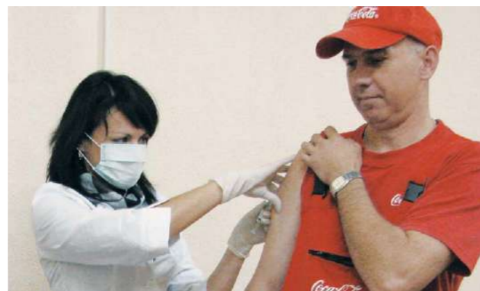
Бесплатная вакцинация против гриппа