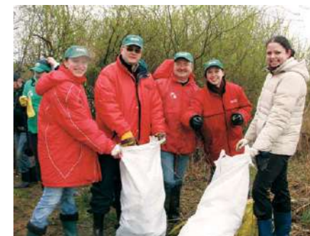
В ходе акции совместными усилиями была проведена уборка территории заказника «Лебяжий»