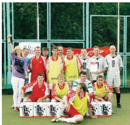
Команда победителей Чемпионата по мини-футболу

На предприятии издается внутренняя газета «Новости ИП «Кока-Кола Бевриджиз Белоруссия».