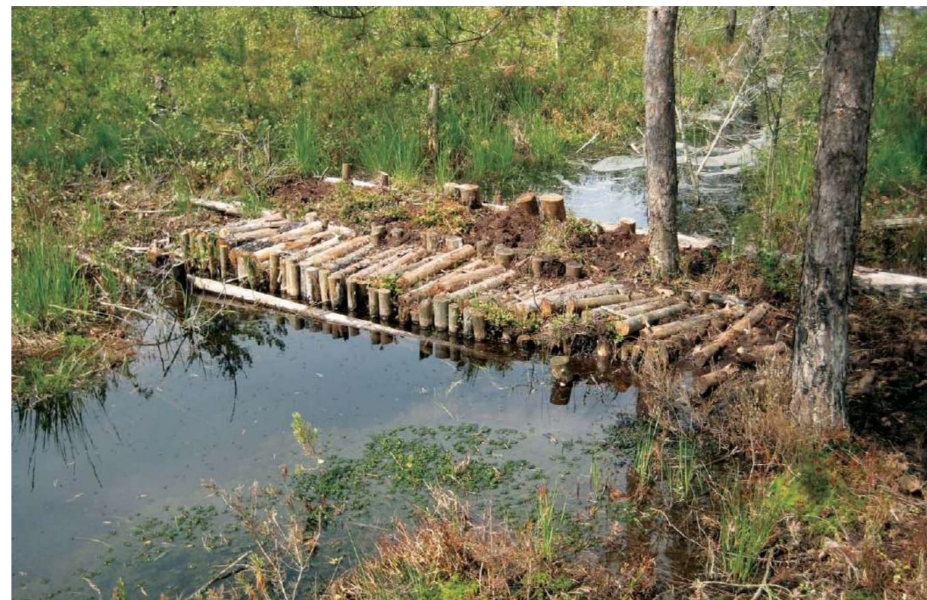
Очередная плотина возведена командой сотрудников предприятия