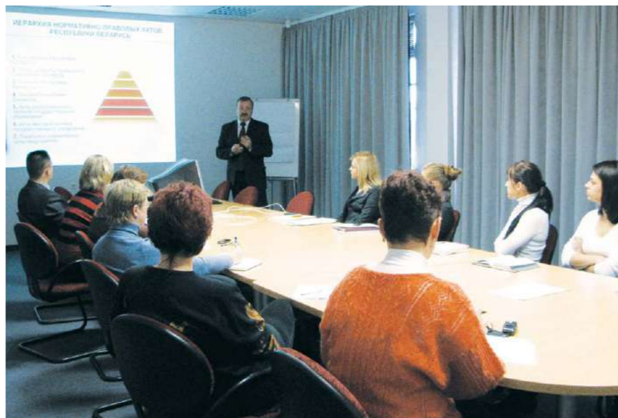
Руководители структурных подразделений проводят обучение сотрудников предприятия по соответствующим отраслям профессиональных знаний

Руководители структурных подразделений проводят обучение сотрудников предприятия по соответствующим отраслям профессиональных знаний. Институт наставничества находит свое применение также во время «полевого обучения» специалистов по продажам, отличительная особенность которого в том, что в обучение своих подчиненных вовлечено 100% менеджеров коммерческого отдела. На предприятии функционирует система дистанционного обучения для сотрудников, работающих на филиалах.