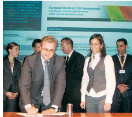
Торжественное подписание Меморандума о взаимопонимании и сотрудничестве в области корпоративной социальной ответственности

Ряд предложений ИП «Кока-Кола Бевриджиз Белоруссия» по совершенствованию законодательства с целью повышения привлекательности условий для ведения бизнеса на территории Республики Беларусь был принят Правительством Республики Беларусь и нашел свое отражение в нормативных правовых актах в 2010 году.