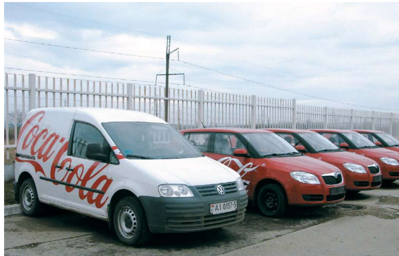
Соответствие приобретаемой техники белорусским и международным экологическим стандартам — основной критерий при обновлении транспортного парка

Опыт ИП «Кока-Кола Бевриджиз Белоруссия» по мотивации водителей на экономию топлива признан в группе предприятий Coca-Cola Hellenic показательным проектом и рекомендован для применения в других странах. В 2010 году программа включена в корпоративную базу лучших практик Coca-Cola Hellenic.