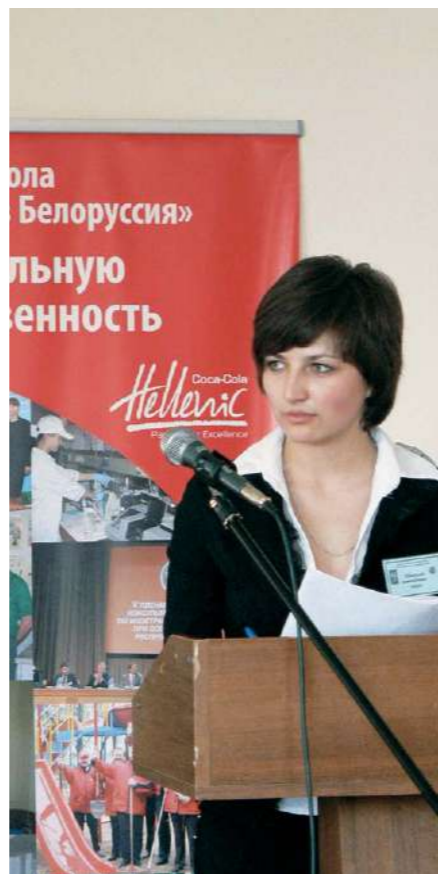
Участники олимпиады отстаивают свою позицию в инсценированном судебном заседании перед жюри

Теперь уникальные «белорусские» бутылки Соса-Кола украшают офис ИП «Кока-Кола Бевриджиз Белоруссия» в Колядичах под Минском.