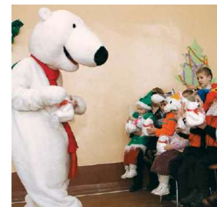
Новогодний «Караван Coca-Cola» приносит радость в детские дома