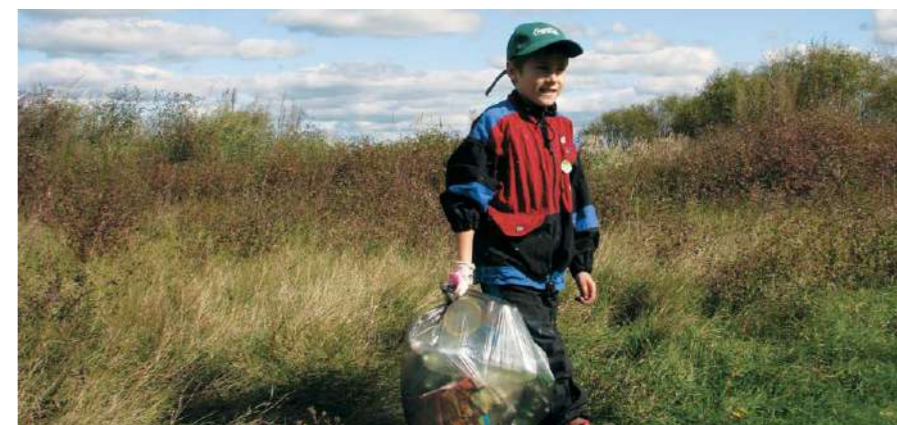
Школьники Турова узнали много нового о родной природе и с радостью поучаствовали в сохранении ее чистоты