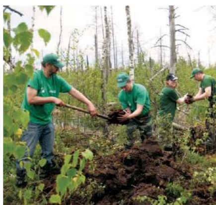
Каждый участник волонтерского лагеря на Ельне внес свой вклад