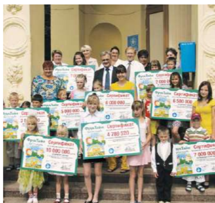
Денежные сертификаты были вручены 10 детским домам семейного типа