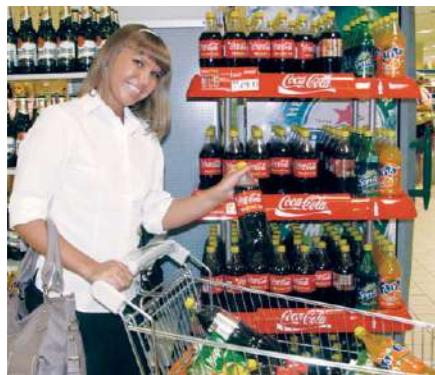
Высшей наградой для предприятия является доверие потребителей