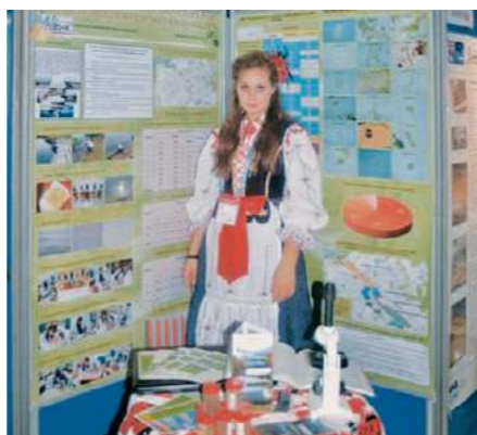
Победитель Национального этапа на Международном финале конкурса в Стокгольме