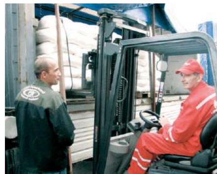
Приемка сахара ОАО «Городейский сахарный комбинат»

Широкая сеть поставщиков, включающая более 1100 предприятий и организаций, снабжает ИП «Кока-Кола Бевриджиз Белоруссия» необходимым сырьем и материалами.