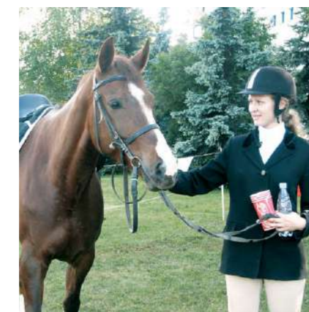
Празднование Международного Олимпийского дня в Гомеле