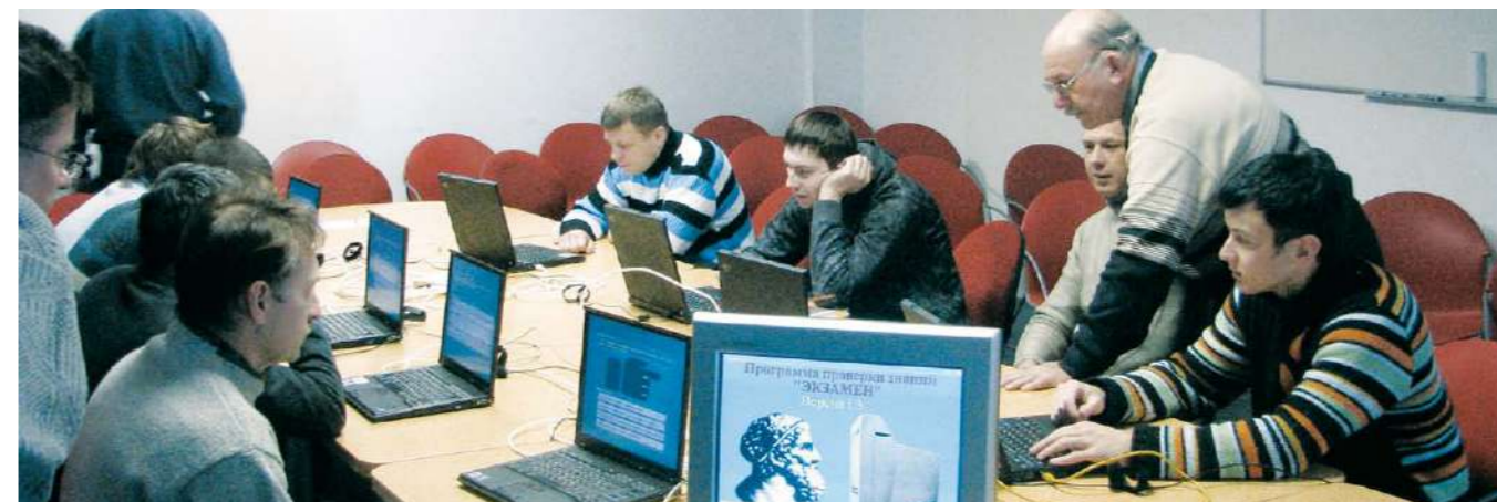
Предприятием налажено непрерывное обучение всех категорий сотрудников

на территории предприятия. Более 160 сотрудников проверили состояние своего здоровья.