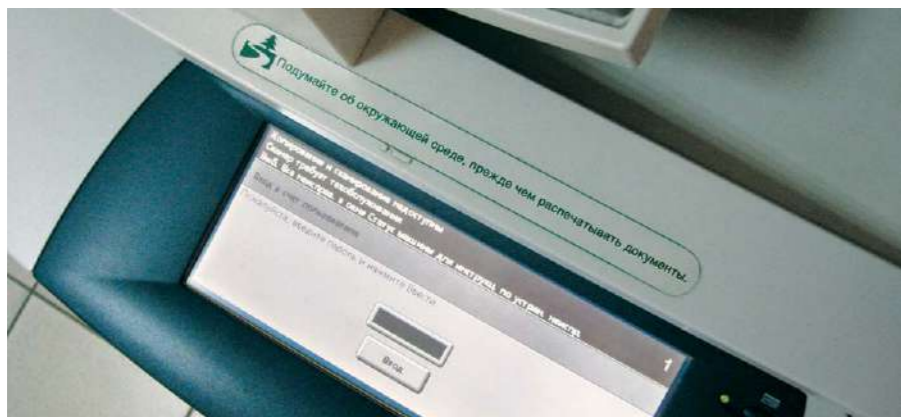
Предприятие уделяет постоянное внимание пропаганде экологических знаний среди работников