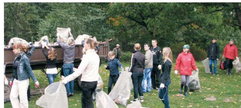
Сотрудники предприятия и студенты внесли реальный вклад в очистку берегов Ислочи