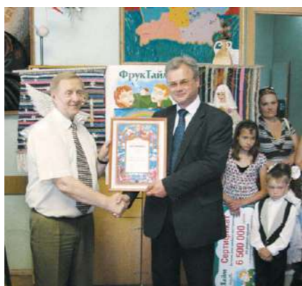
Вручение Почетного сертификата Генерального Спонсора

Всего за время акции предприятие перечислило Белорусскому детскому фонду около 60 миллионов рублей.