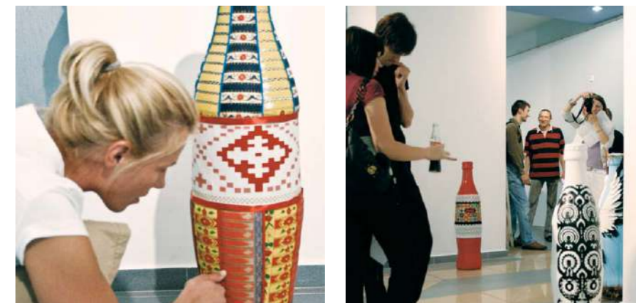
Выставка бутылок Соса-Кола в национальном стиле в галерее искусств БГАИ

С каждым годом все больше взрослых и детей хотят посетить завод. Экскурсии проводятся бесплатно, и каждый имеет возможность прикоснуться к волшебному миру Соса-Кола. В 2008 предприятие «Кока-Кола Бевриджиз Белоруссия» открыло свои двери для большого потока людей, и в тот год завод посетило более 12 тысяч человек. Интерес к бренду и процессу производства с каждым годом все возрастает: за 2010 год предприятие приняло более 20,5 тысяч гостей!