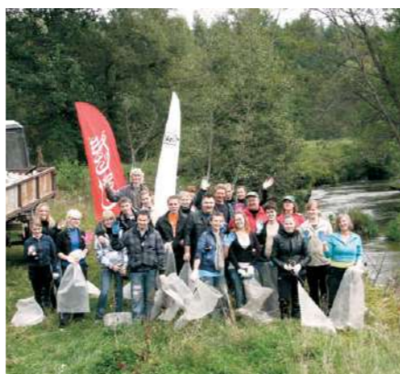
В результате акции было собрано около 30 кубических метров мусора